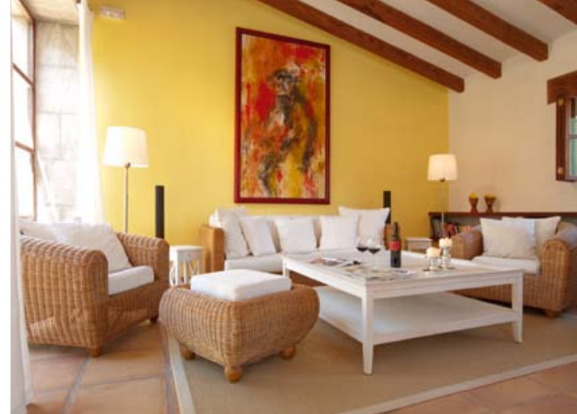
Die Limón Suite mit eigenem Garten ist die größte im Haus. Sie ist im Maisonette-Stil angelegt.