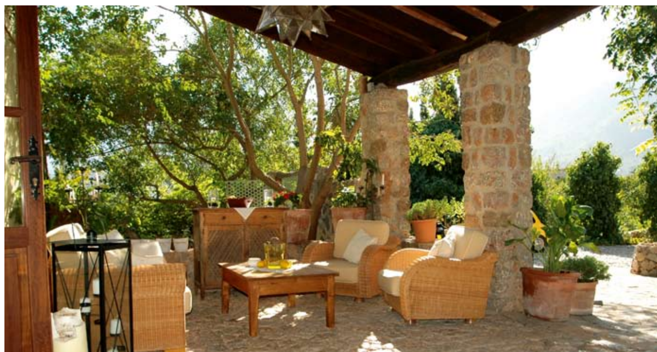
Der lauschige überdachte Eingangsbereich gehört zu den luftigen Lieblingsplätzen am Haus. Oft sitzen Gäste dort bis in die Nacht.

höchstpersönlich in die Küche. Aus ihrer kleinen feinen Bodega reichen sie ausgewählte Weine, die so manche Geschichte erzählen, nicht nur über Mallorca, sondern auch über die Welt des Genießens. Besonders an den lauschigen Sommerabenden, wenn der Garten vom sanften Schein unzähliger Kerzen erleuchtet wird und das Publikum in unbeschwerter Runde fröhlich plaudernd beisammen sitzt, macht sich das ganze Flair dieser herrlichen Anlage breit. Wer Privatsphäre schätzt und seine Erholung in einem niveaувollen Umfeld zelebrieren möchte, ist im FincaHotel Can Coll bestens aufgehoben. Zusätzlich verspricht ein kleiner, jedoch exklusiver Health & Beauty-Bereich in dem ganzheitliche Behandlungsverfahren zur Anwendung kommen, Regeneration für Körper, Geist und Seele. Wirkungsvolle Unterstützung leisten dabei die luxuriösen Produkte von Ligne St. Barth und Cavance. Auch ist das Hotel der ideale Ausgangspunkt für spektakuläre Inselstouren, für Golfer, Reit- und Fahrrad-Enthusiasten. Ins pittoreske Städtchen Sóller sind es nur zehn geruh-same Fußminuten, nach Port Sóller keine fünf Minuten mit dem Auto. Es lohnt sich also einmal vorbeizuschauen. ■